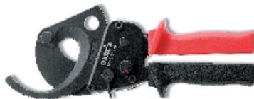
Инструмент ручной автоматический