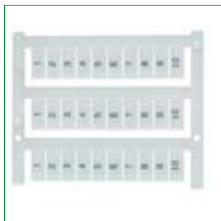
PMC пример FS (последовательные верт.)