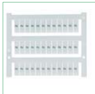
PMC пример GS (идентичные верт.)