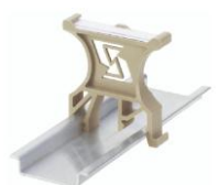
GT1, GT2 Маркировники на рейку TS 32/35